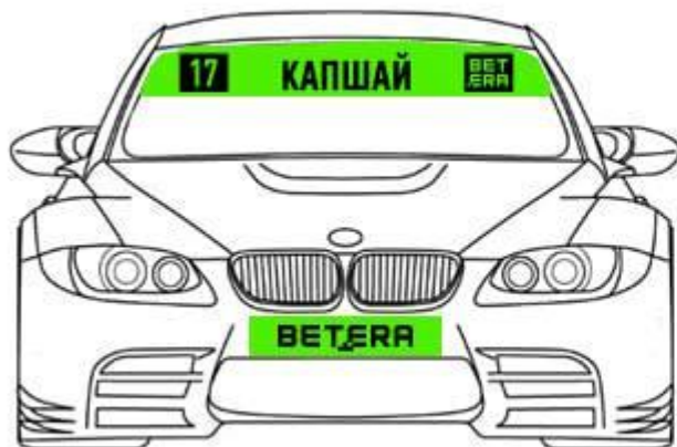
Схема размещения наклеек