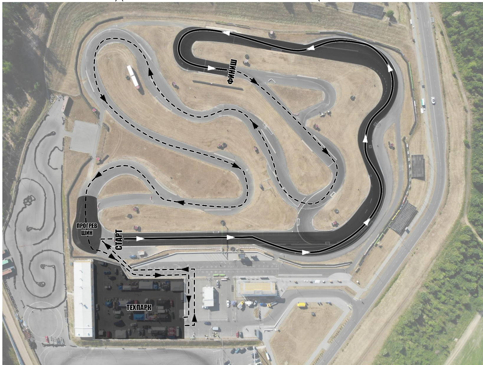
СХЕМА ДВИЖЕНИЯ ПО ТРАССЕ И ВОЗВРАЩЕНИЯ В ТЕХПАРК