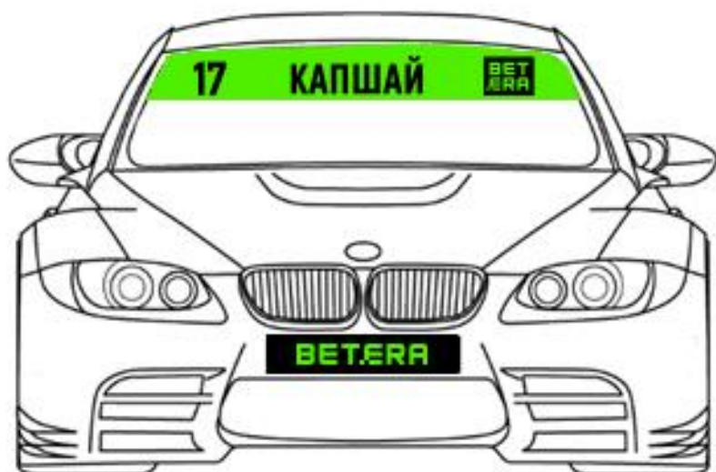
Схема размещения наклеек