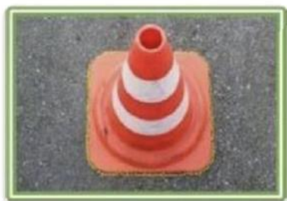
конус полностью находится внутри обозначенной разметки