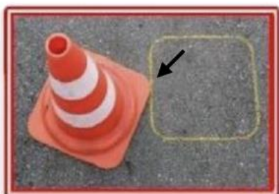
конус не касается своей разметки