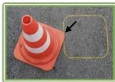
конус все еще касается своей разметки