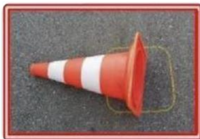
конус упал и находится внутри своей разметки