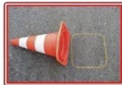
конус упал и находится за пределами своей разметки