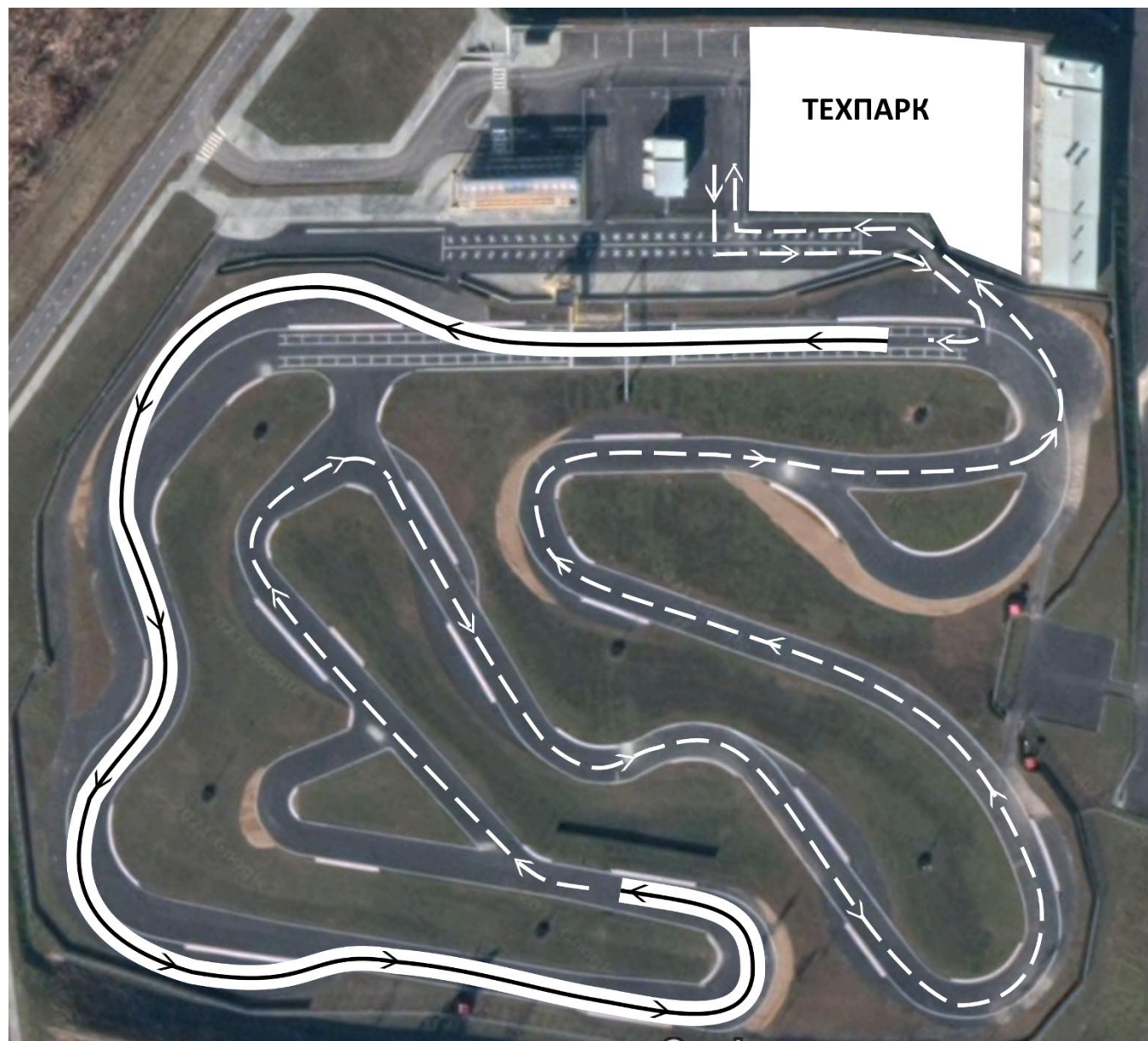
СХЕМА ДВИЖЕНИЯ ПО ТРАССЕ И ВОЗВРАЩЕНИЯ В ТЕХПАРК