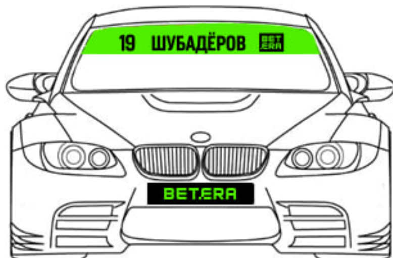
Схема размещения наклеек