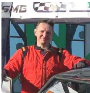
Заместитель руководителя гонки по безопасности и маршруту (комиссар по безопасности, комиссар по маршруту)