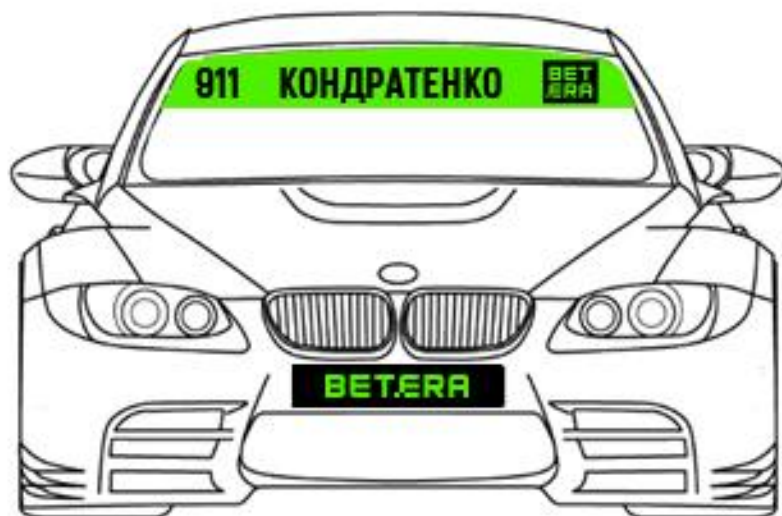
Схема размещения наклеек