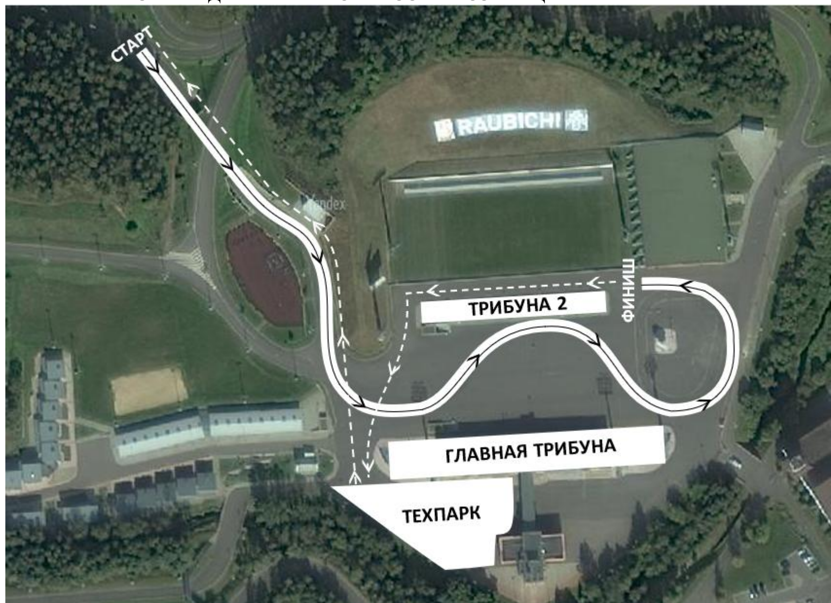
СХЕМА ДВИЖЕНИЯ ПО ТРАССЕ И ВОЗВРАЩЕНИЯ В ТЕХПАРК